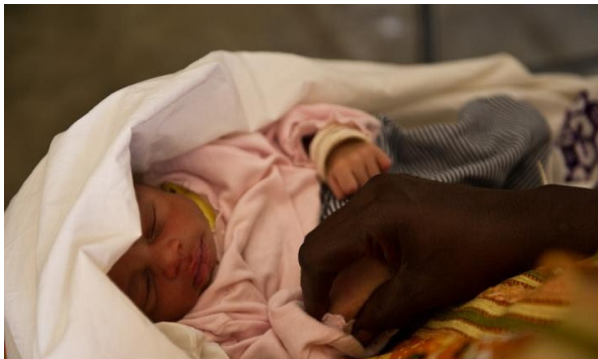
Protège ton bébé contre le VIH. Zéro transmission, Zéro décès

Les bénéficiaires directs seront : 25 relais communautaires ; 240 femmes enceintes ; 100 jeunes filles en âge de procréer ; 100 conjoints de femmes enceintes ; 20 PVVIH ; 300 fidèles d'églises et mosquées ; 300 membres d'associations de Mossikro.